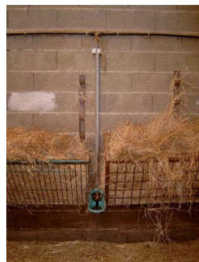
Bebedeiro e comedero adaptable á altura do esterco.

HAI ENTRADAS PARA A FEIRA A DISPOSICIÓN DOS SOCIOS/AS DE OVICA. Contacta co local de Lugo.